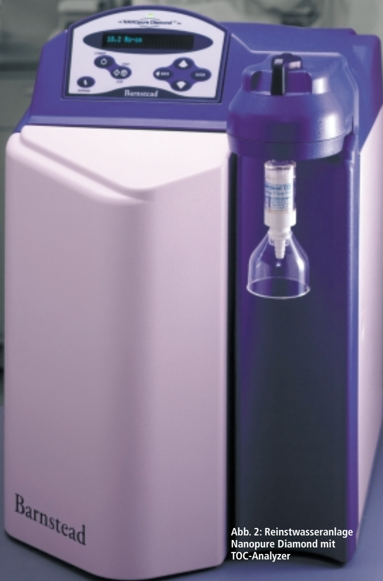
Abb. 2: Reinstwasseranlage Nanopure Diamond mit TOC-Analyzer

Abbildung 1 zeigt die Abhängigkeit des Zetapotentials eines \text{TiO}_2 -Pigmentes vom pH-Wert. An der Stelle \text{pH}=8,1 befindet sich der Nulldurchgang der Kurve oder der Isoelektrische Punkt (IEP), d.h. hier hat das Zetapotential den Wert 0 mV. An diesem Punkt findet keine